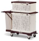
MagicArt 26 Safety Plus